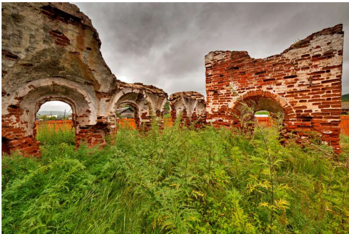
Рис. 2. Руины Троицкой церкви в Сухановой слободе

Главное творение Кирилла Васильевича – Троицкая церковь пережила разные перипетии: строительство на месте бывшей слободы станции Бушулей, революционные потрясения, разрушительную гражданскую войну. Говорят, что церковь неплохо выглядела еще в 60-е гг. XX столетия. Сейчас же от нее остались одни лишь руины (рис. 2).