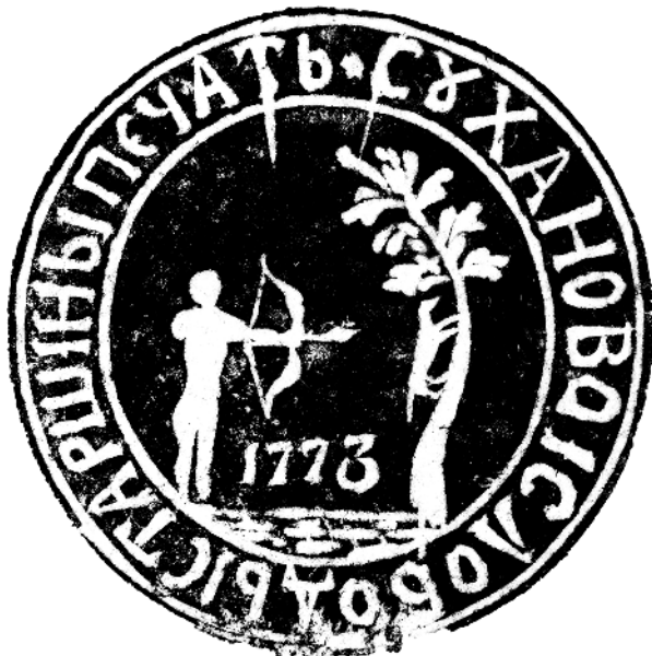
Рис. 1. Печать Сухановой слободы [3, л. 279]

ние инородцами и связь с властями отвечал старшина. Для заверения деловых документов и писем начальству он использовал специальную печать, украшенную стилизованной композицией, напоминавшей об охотничьем промысле тунгусов (рис. 1).