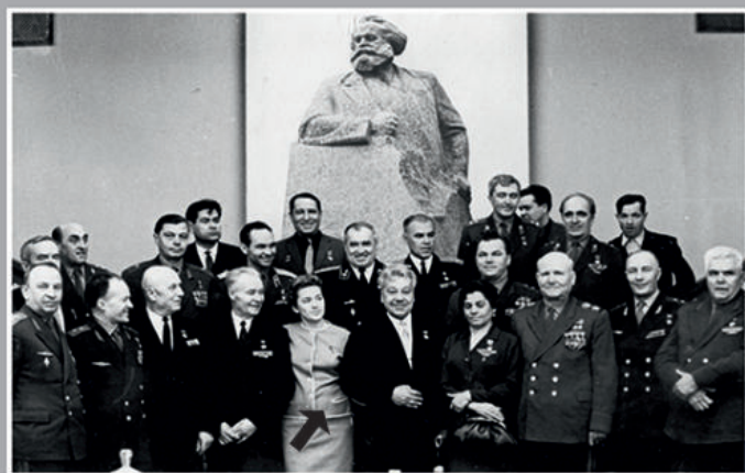
Встреча Героев Советского Союза в редакции газеты «Правда».

Надежда Троян обладала редким даром: она умела дружить. Среди ее друзей были самые разные люди: медсестры и академики, партизаны и летчики, писатели и разведчики... Люди были ей интересны, она старалась учиться у них и помогать им.