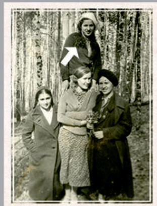
Перед испытаниями по алгебре. Май, 1939 год.