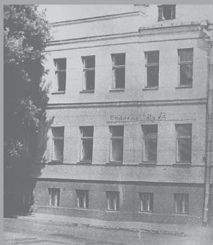
Дом, где жил гауляйтер Кубе.

В июле 1943 года Надежде Троян было дано боевое задание: найти подходы к ближайшему окружению гауляйтера Кубе.