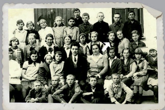
Среди одноклассников в красноярской школе.