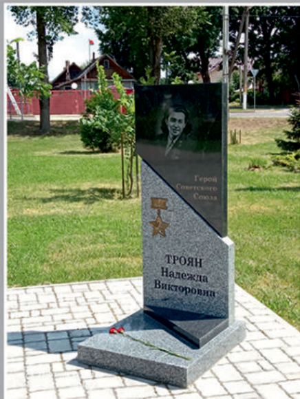
Жители Верхнедвинска (Беларусь) хранят память о своей землячке.