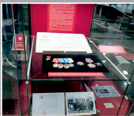
Экспозиция в Музее Победы.