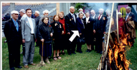
Каждый год 29 июня, в День партизана и подпольщика, ветераны разжигают партизанский костер.