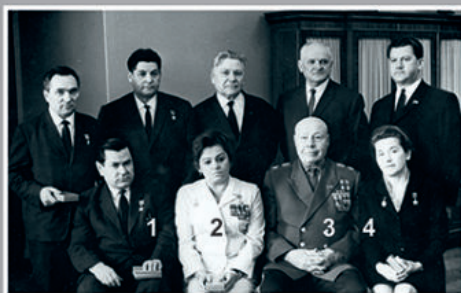
Советский комитет ветеранов войны: Герои Советского Союза А.П. Маресьев (1) М.П. Чечнева (2), С.К. Тимошенко (3), Н.В. Троян (4).

Огромное место в жизни Н.В. Троян занимали ее фронтовые друзья. Она старалась помогать тем, кто остался в живых, и сохранить память о погибших героях.