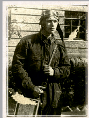
Одноклассник Надежды – Борис Галушкин (будущий Герой Советского Союза).