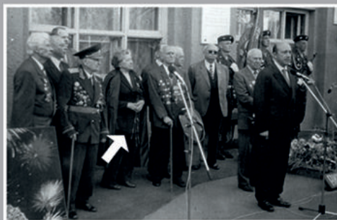
У мемориальной доски ОМСБОН на стадионе «Динамо».