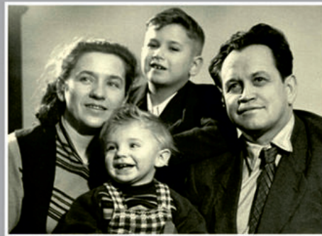
В кругу семьи.