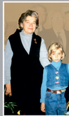
Любимая бабушка и внучки.