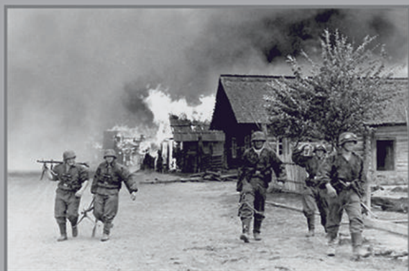
За годы оккупации Белоруссии фашисты сожгли 9 тысяч 200 сел и деревень, уничтожили 2 миллиона 230 тысяч жителей.