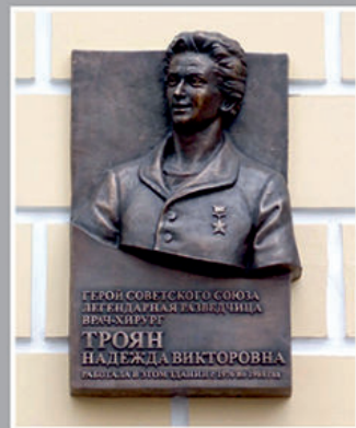
Мемориальная доска на здании Первого московского медицинского университета им. И.М. Сеченова.