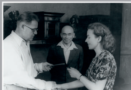
В 1947 году получает диплом «с отличием».

Становится хирургом на кафедре госпитальной хирургии 1-го ММИ им. И.М. Сеченова, которой руководил один из основоположников советской хирургии профессор Борис Васильевич Петровский.