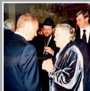
С В.В. Путиным на приеме в Кремле 9 мая 2003 года. Обсуждают увековечение памяти партизан и подпольщиков.