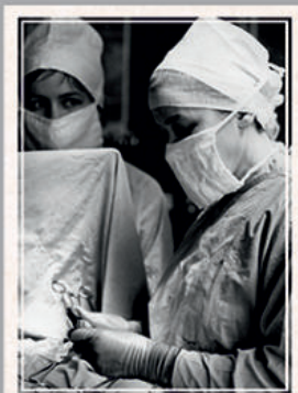
Во время хирургической операции.