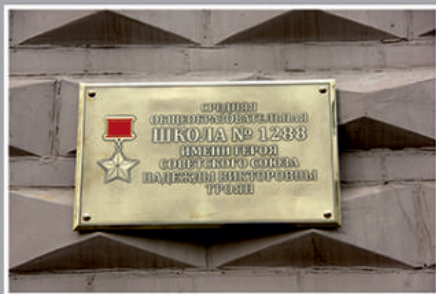
Школе № 1288 присвоено имя Героя Советского Союза Надежды Викторовны Троян.