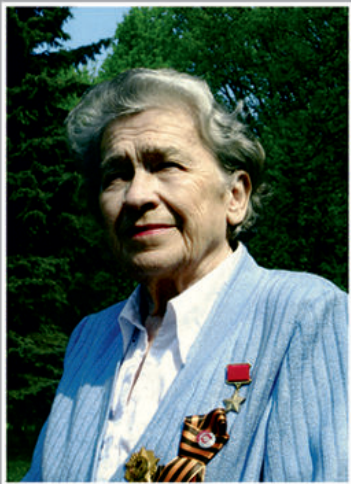
Человек жив, пока жива память о нём.