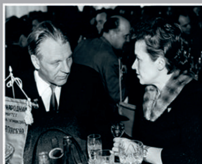
Н.В. Троян и писатель С.С. Смирнов (автор книги «Брестская крепость»).