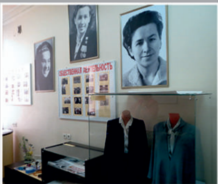
Школьный музей Н.В. Троян.