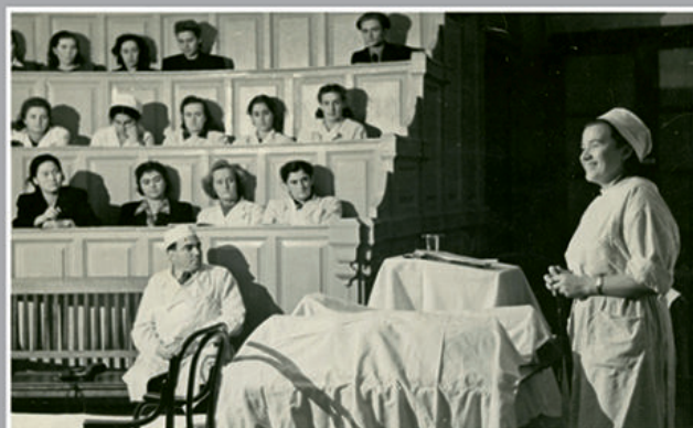
Лекция для студентов.