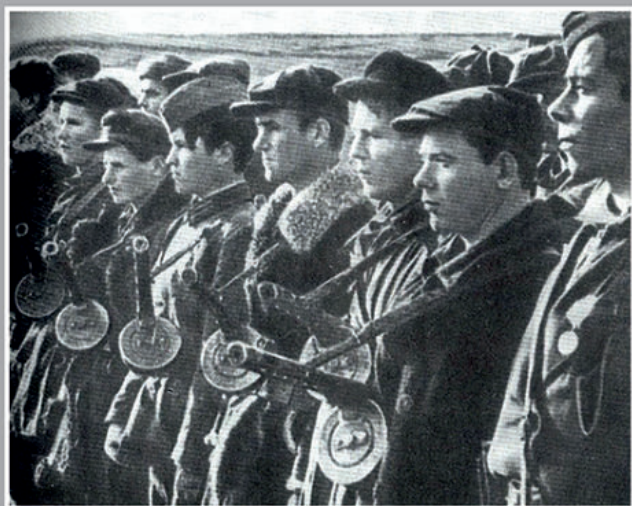
Летом 1942 года становится бойцом партизанской бригады, участвует в боях с врагом, взрывах эшелонов с фашистами.