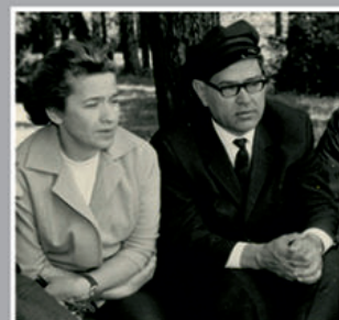
С Героем Советского Союза летчиком А.П. Маресьевым, о котором была написана «Повесть о настоящем человеке».