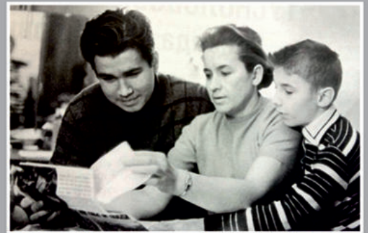
Вместе с сыновьями разбирает почту.