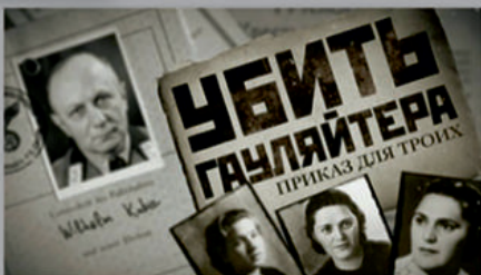
О жизни и подвиге Н.В. Троян написаны книги и сняты кинофильмы.