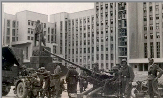
Фашисты заняли Минск на 6-й день войны.