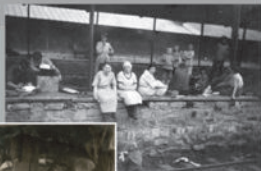
Колонисты на заводской фабрике в Кузбассе