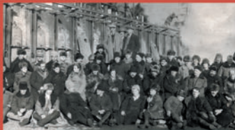
Рабочие в колонии сидят на ступеньках КХЗ, ступеньки были построены колонистами