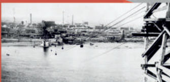
Вид с воды, на котором делаются фото, на колонистов в этот момент бежал