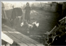
Молочница колониатам в Кузбассе