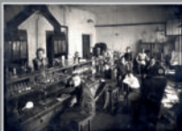
Лаборатория химической лаборатории