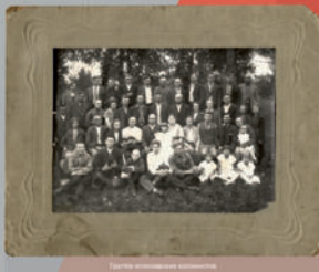
Группа японских колонистов