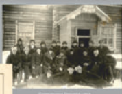
Сотрудники Прованье АИК