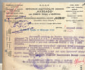
Телеграмма СТО об окончании строительства завода