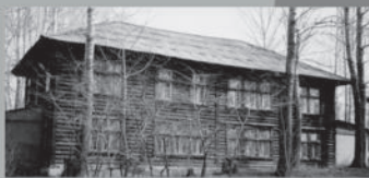
Главный офис фермы на территории колонии