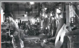
Механический цех завода Сайт Маглера в Кемерово