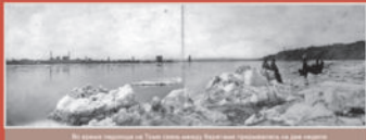
На первом изображении на Томи видно завод. Второй вид - промышленность на дне реки.

Для проживания и питания в 1923 году в поселке организовали столовую. Это был единственный ресторан для 3 многонационального предприятия.