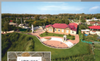
Музей «Красная Горка» в Дворе Руттера