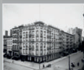
Здание 27 State Street, Нью-Йорк, 1919 - второе здание американского центра АИК