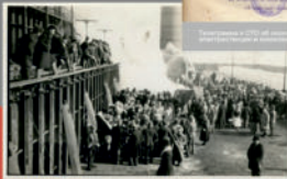
После окончания строительства завода