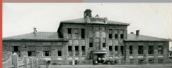
Президиум АИК в здании Главной конторы. Екатеринбург, рудник

В России конторы АИК были открыты в Москве, Свердловске (Екатеринбурге), Томске, Новосибирске. Управление АИК находилось на Енисермовском руднике.