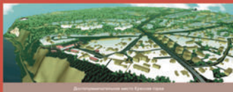
Демонстрационная часть Красной Горы

На Красной горе сохранились постройки Ван Лохема, являющиеся памятниками регионального значения и объектами совместного российско-голландского культурного наследия. Данное здание школы признано в Нидерландах архитектурным наследием за рубежом. При Финансовой поддержке Нидерландов разработан проект ее реставрации. В 2010 году территории Красной горы получили статус достопримечательного места и была введена в государственный реестр объектов культурного наследия народов России. Развитие достопримечательного места Красная Гора предполагает реставрацию памятников, создание Музея угля Кузбасса и туристической инфраструктуры, что позволит превратить бывший промышленный район в крупный музейно-туристический комплекс.