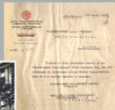
Американское представительство АИК в Нью-Йорке, Нью-Йорк, 1919