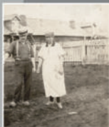
Посадочница - работница фермы