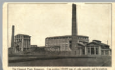
Первый коксохимический завод

2 марта 1924 год под звуки "Интернационала" был произведен первый коки. На торжественном митинге присутствовало 1,5 тысячи человек: колонисты, жители города, гости из Москвы, Новосибирска, Томска, Екатеринбурга. Звучали также приветственные телеграммы из США, Голландии, Германии, Англии. Впоследствии колонистами была построена 2-я и частично 3-я батареи коксовых печей. Кемеровский коки и химические продукты поставлялись в Москву, Ленинград, Омск, Красноярск, Тольятти, Нижний Новгород и другие города Советского Союза.