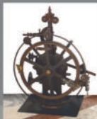
Деталька от музея АИСК, подаренная коллегам в подарок