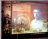
Музейная экспозиция в музее «Красная Горка»