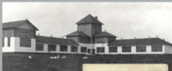
Дом Коммуны в Кемерово

В 1925 году Правление АИК разработало программу масштабного жилищного строительства. Для ее реализации был приглашен голландский архитектор Иоханнес Бернадтус ван Локам и создан Строительное бюро под руководством голландца Антона Струйка и Дирка Шпрингера. В 1926-27 годах Ван Локам построил в Кузбассе четыре рабочих поселка, которые стали одним из первых в Советской России опытов жилищного строительства. Поселки были застроены типовыми благоустроенными домами с электроточкой, водопроводом, канализацией. На Кемеровском руднике нехваткой были заблокированные дома из секций-квартир, пустотельные кирпичные стены, квартиры в двух уровнях с мансардными этажами. Кроме жилых домов были построены школы, магазины, бани и другие объекты. Усилиями бюрократизации, упреждающего аппарата поднимала всякая возможность творческой работы. Оставшие свои планы незавершенными, Ван Локам вернулся на родину. В Кемерово экономичные типы домов, разработанные Ван Локомом, оказались незаменимыми и долгое время использовались в застройке города.