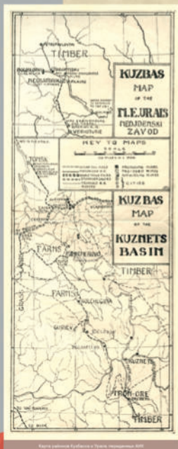
Карта района Кузбасса и Тлеуральского завода

В Кузбассе в оперативное управление АМК были переданы: Кемеровский, Ленинск-Кузнецкий, Прокопьевский рудники, Кемеровский коксохимический и Гурьевский металлургический заводы. Главной задачей руководителем АМК было техническое перевооружение шахт и пути коксохимического завода.