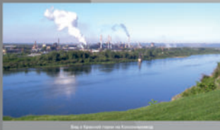
Вид с Красной Горы на Красногорский

Сегодня в горах Кемерово сохранилась и материальная память об АИК, Кемеровский завод, построенный колонистами, стал одним из крупнейших в России производителей и экспортеров металлургического кокса ПАО «Кокс».