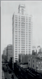
Здание The World's Work Building, Нью-Йорк, 1919 - штаб-квартира американского центра АИК

Американское бюро открыло около 30 центров поддержки АИК в 10 штатах США и в двух провинциях Канады.