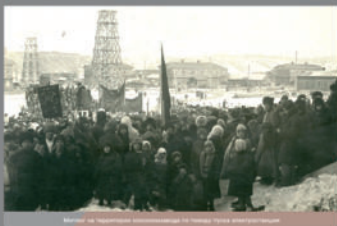
Митинг на территории колониальной шахты перед электрификацией.