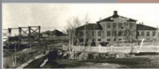
Главное здание Кемеровского рудника