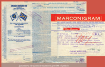
Документы на русском языке для АИК в СССР

В 1923 году две группы сопровождали кинооператоры, отправленные знаменитым американским кинопродюсером В.К. Зигфридом. Они зафиксировали путь колонистов от Нью-Йорка до Кемаров, семьи их за работой в шахтах, мастерами, на спортивных занятиях и во время отдыха. Кроме этого, съемки проводились в Москве, Петрограде, на Урале. Созданный документальный фильм был показан в России и в Хресте Труда в Нью-Йорке.