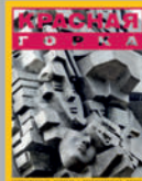
Подарок коллегам в подарок