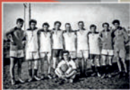
Рабочий коллектив АИК.