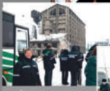
Посетители на выставке