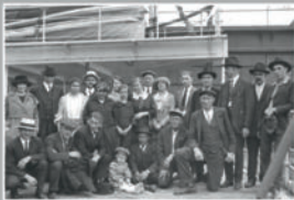
Первая партия колонистов в апреле 1922 года на станции Петербург-Кантемировская перед отплытием на Нью-Йорк

Первая партия колонистов отбыла из Нью-Йорка в Кузбасс 8 апреля 1922 года. Кроме личного багажа они везли с собой продукты, материалы, инструменты, оборудование. Ежегодно, до 1926 года, из США в Кузбасс направлялось несколько партий. Они шли через Атлантический или Тихий океан до Петрограда или Владивостока, а затем добирались до Кемаров по железной дороге. В портах Роттердама и Ливава (Литва) к ним присоединялись колонисты из европейских стран. Путь до Кузбасса занимал две недели.