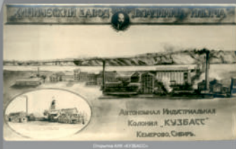
Шахта №10 в Кемерово.

Ключевым вопросом модернизации предприятий АИК была их электрификация. Колонисты в январе 1924 года реализовали план ГОЭЛРО, ввели в строй электростанцию на комбинатском заводе, которая позволила обеспечить электроэнергией завод и городок. Первым в городе электростанцией стала поставщиком электричества Шагловская (Кемерово) для промышленных, бытовых нужд и уличного освещения. Техническое бюро АИК разработало проект электрификации двенадцати окрестных деревень, и за время деятельности колонии удалось провести электричество в пять из них. Модернизация предприятий проводилась и в южной части Кузбасса: на шахтах вводилось новое оборудование, был открыт проектный цех на Гурьевском металлургическом заводе, реконструированы электростанция в Ленинске-Кузнецком.