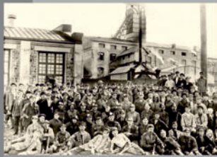
Рабочие Кемеровского рудника в 1926 году.

В результате среднемесячная производительность забойщика поднялась на 10%, горючего - на 15%, трудящиеся по эксплуатации - на 20%. За время существования АИК общий объем добычи угля вырос в 8,5 раза.