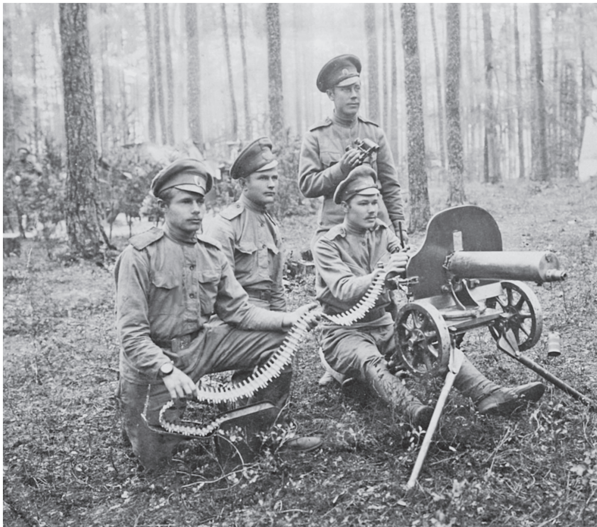
Расчет русского станкового пулемета Максим. 1914—1915 гг.

не полностью. Наступательным действиям помешали затянувшиеся холода (до мая 1915 г. перевалы были занесены снегом), а также действия османских отрядов и повстанцев в Батумской области и боязнь распространения тифа. В равной мере сказывалась завышенная оценка противника, были опасения перехода Персии на сторону Центральных держав. К тому же в феврале началась десантная операция союзников в