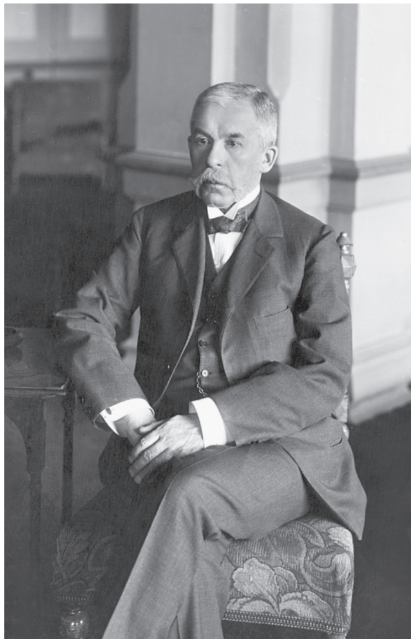
Член Государственного совета, статс-секретарь П. Н. Дурново. Петроград. 1915 г.

Между тем перспективы «большой» войны для России определялись не абстрактными «темпами роста» ее экономики