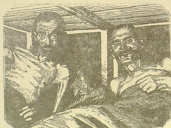
Заключенные из лагеря „Равенсбрюк“, освобожденные Красной Армией.