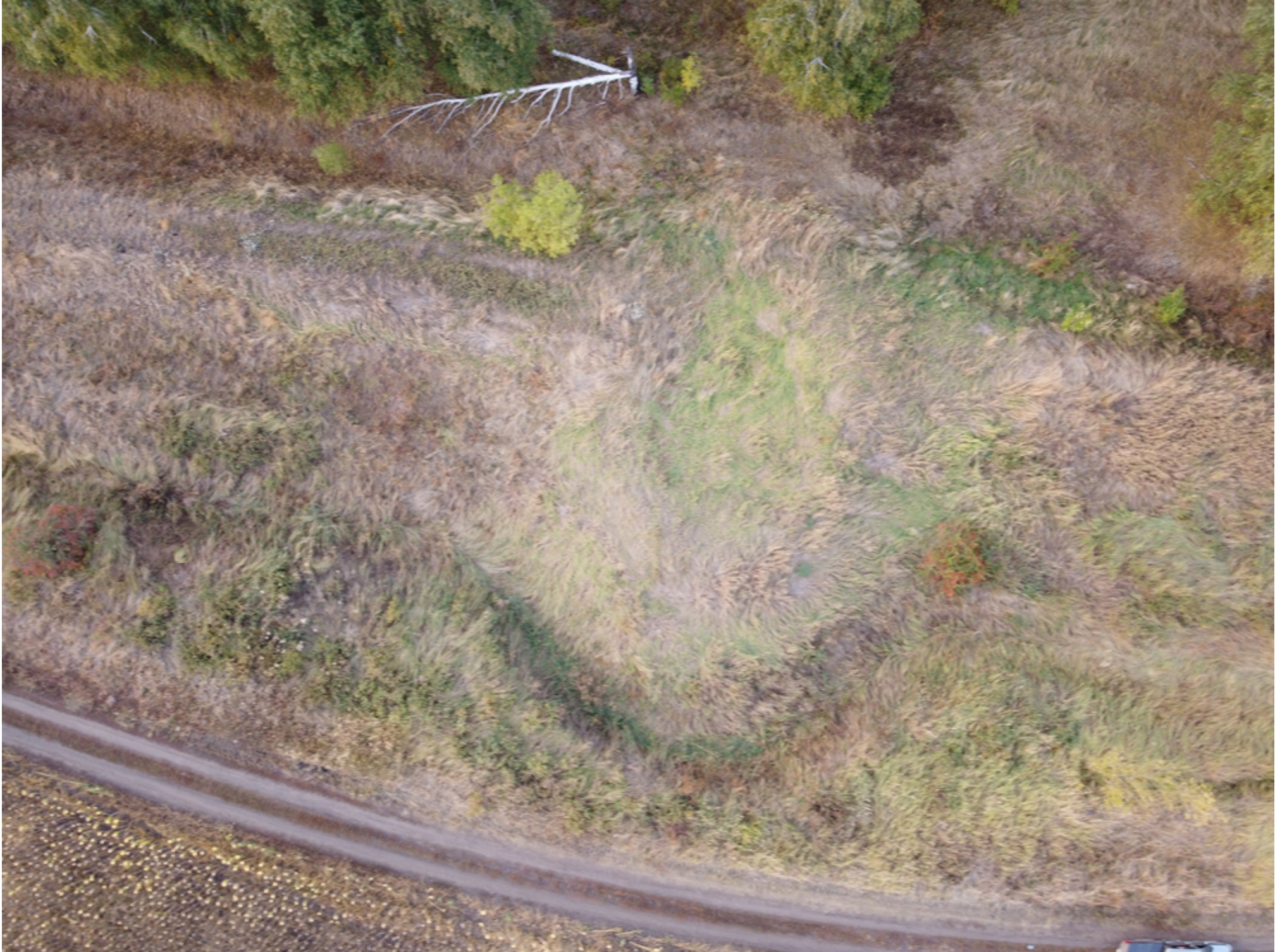
Рис. 7. Городок («земляная башня») на Козловском валу