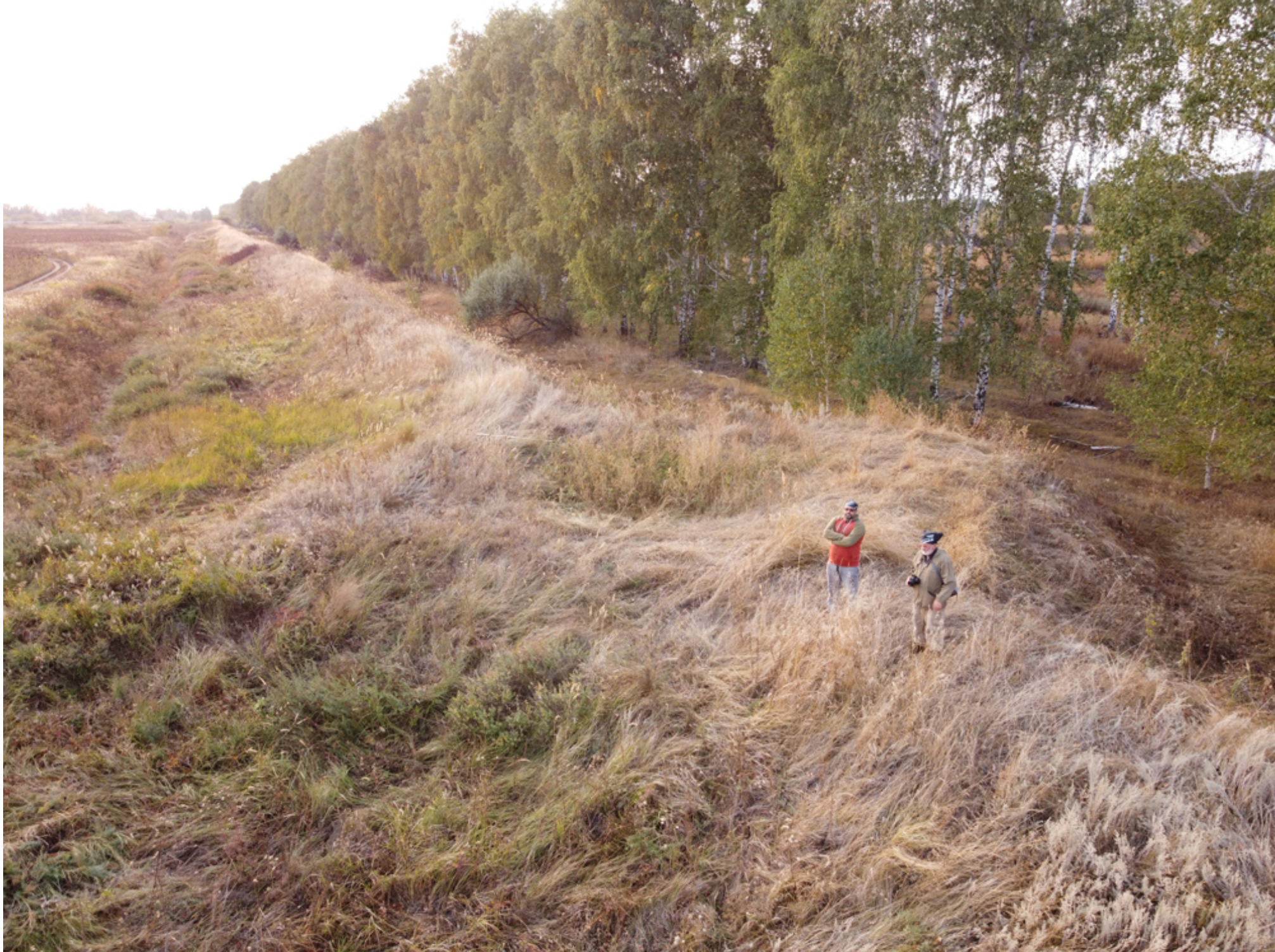
Рис. 8. Городок («земляная башня») на Козловском валу