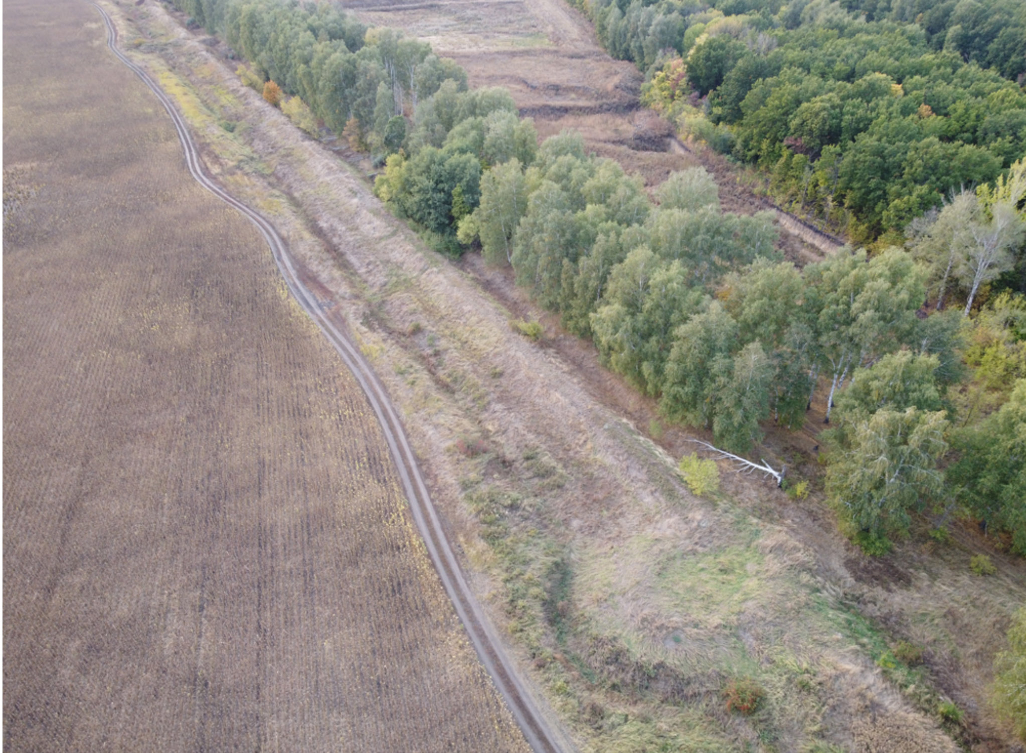
Рис. 6. Участок Козловского вала с городком