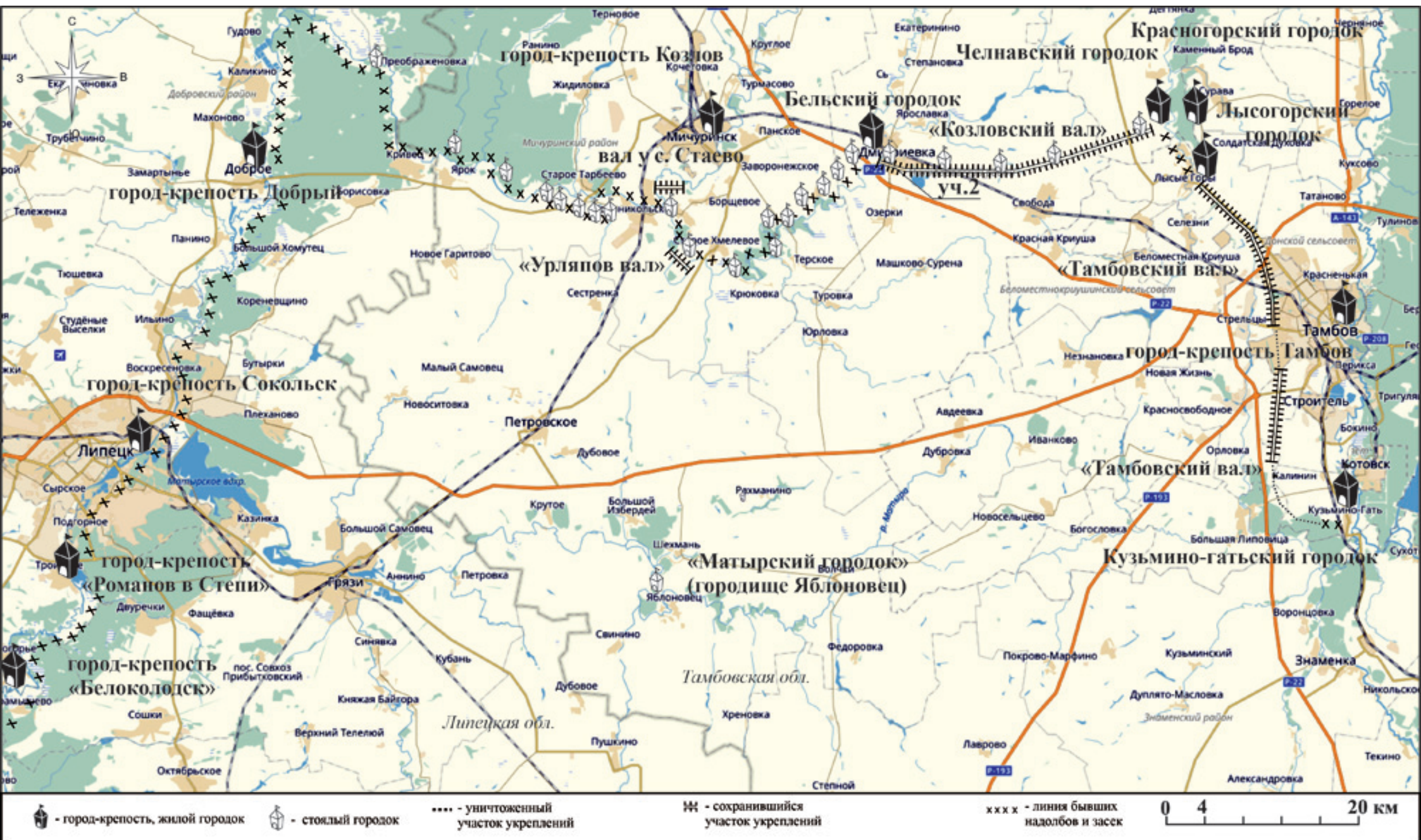
Рис. 2. Карта-схема Козловского участка