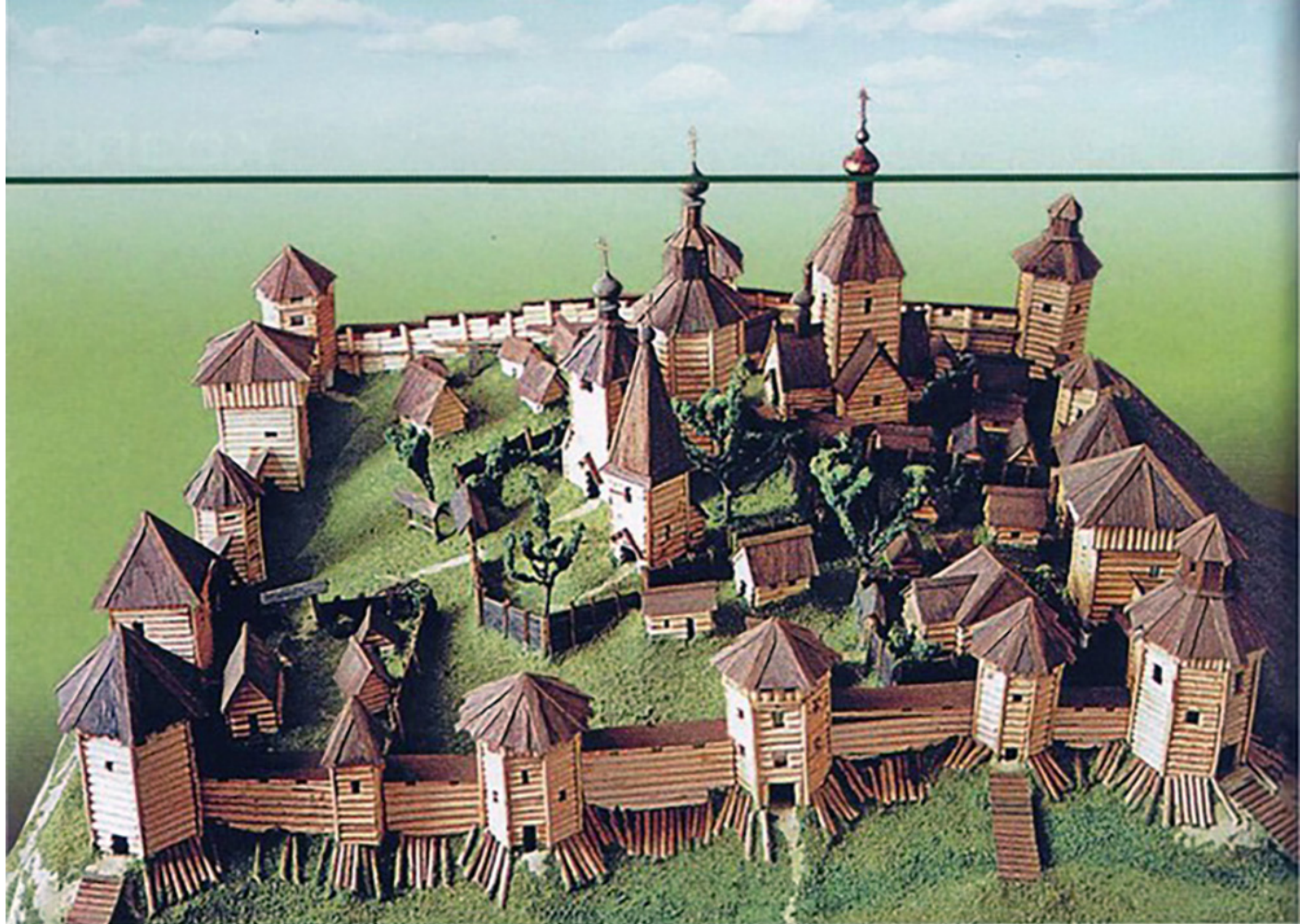
Рис. 4. Макет города-крепости Козлов (Мичуринский краеведческий музей)