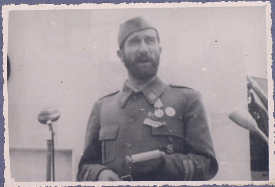
Выступление министра вн. дел Югославии Зечевица.