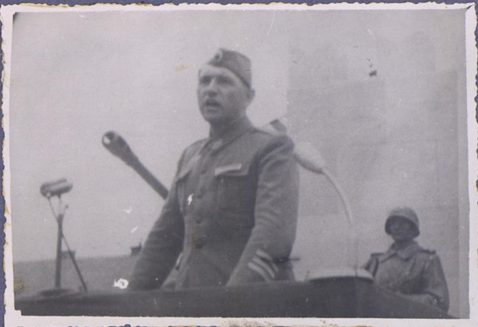
Выступление генерал-поручика Тогославокой армии. Горняка.