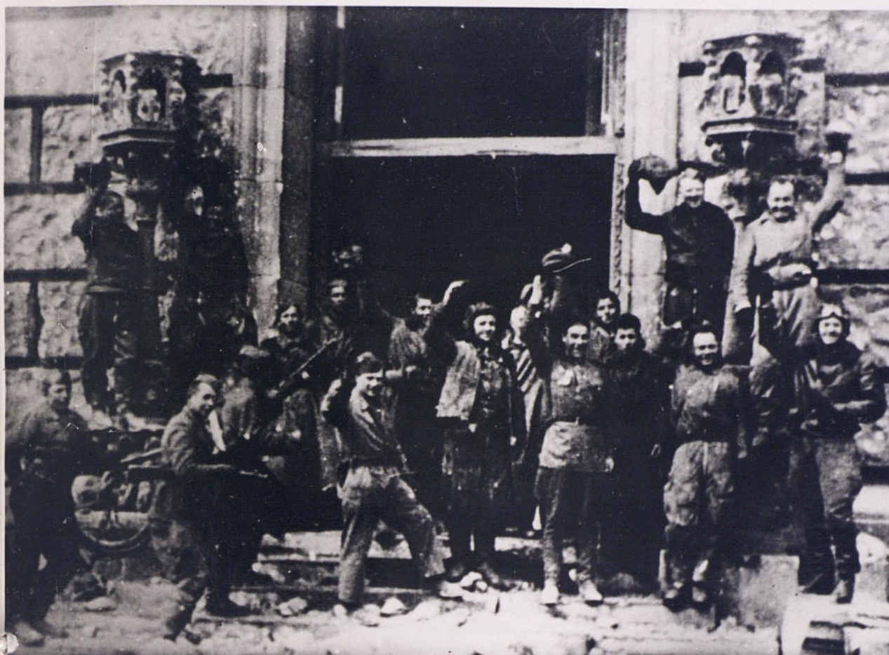
После капитуляции Германии в мае 1945 года советские солдаты у здания Рейхстага.