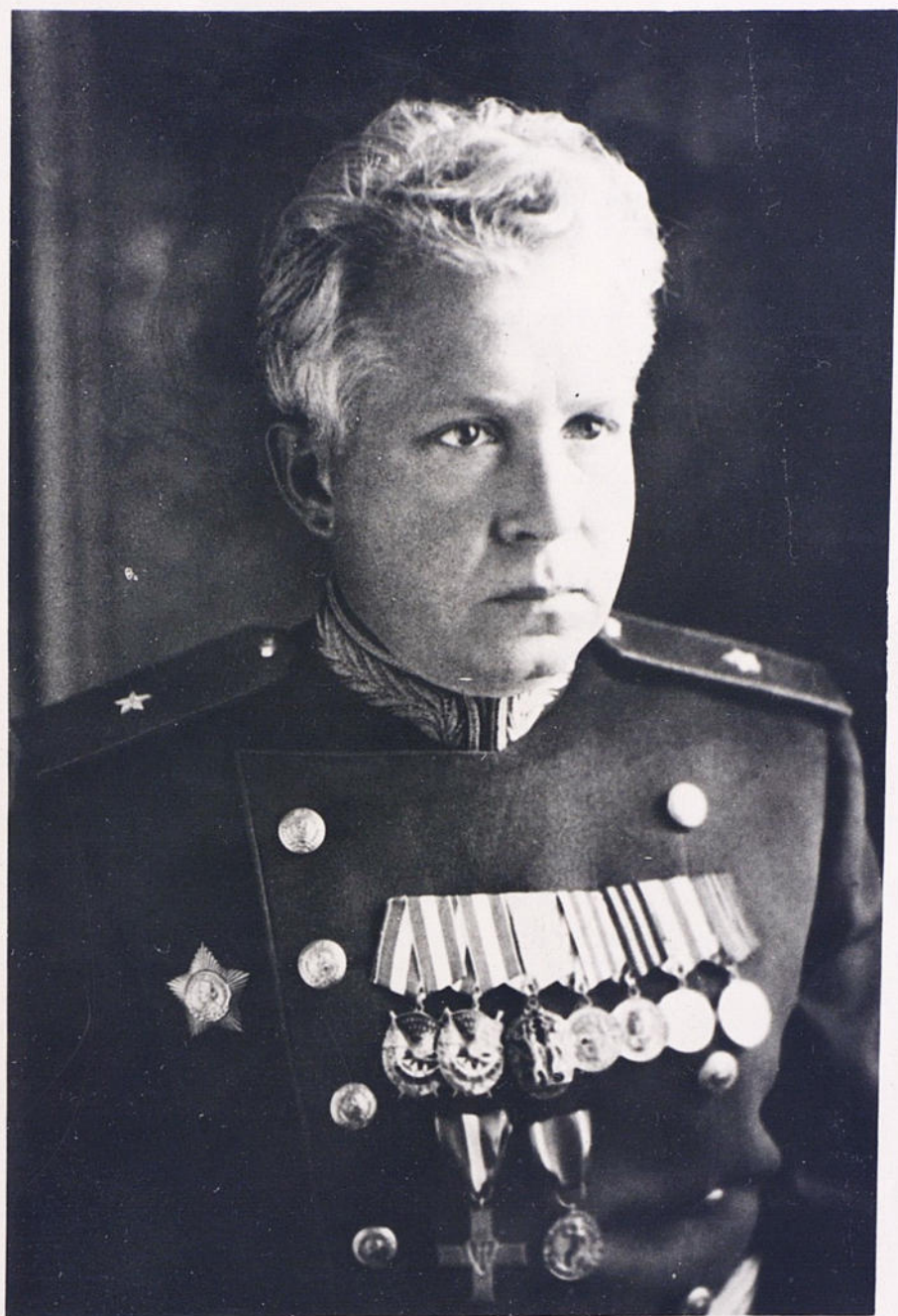
начальник гарнизона и военный комендант Г. Берлин генерал-майор А.Г. Лотиков.