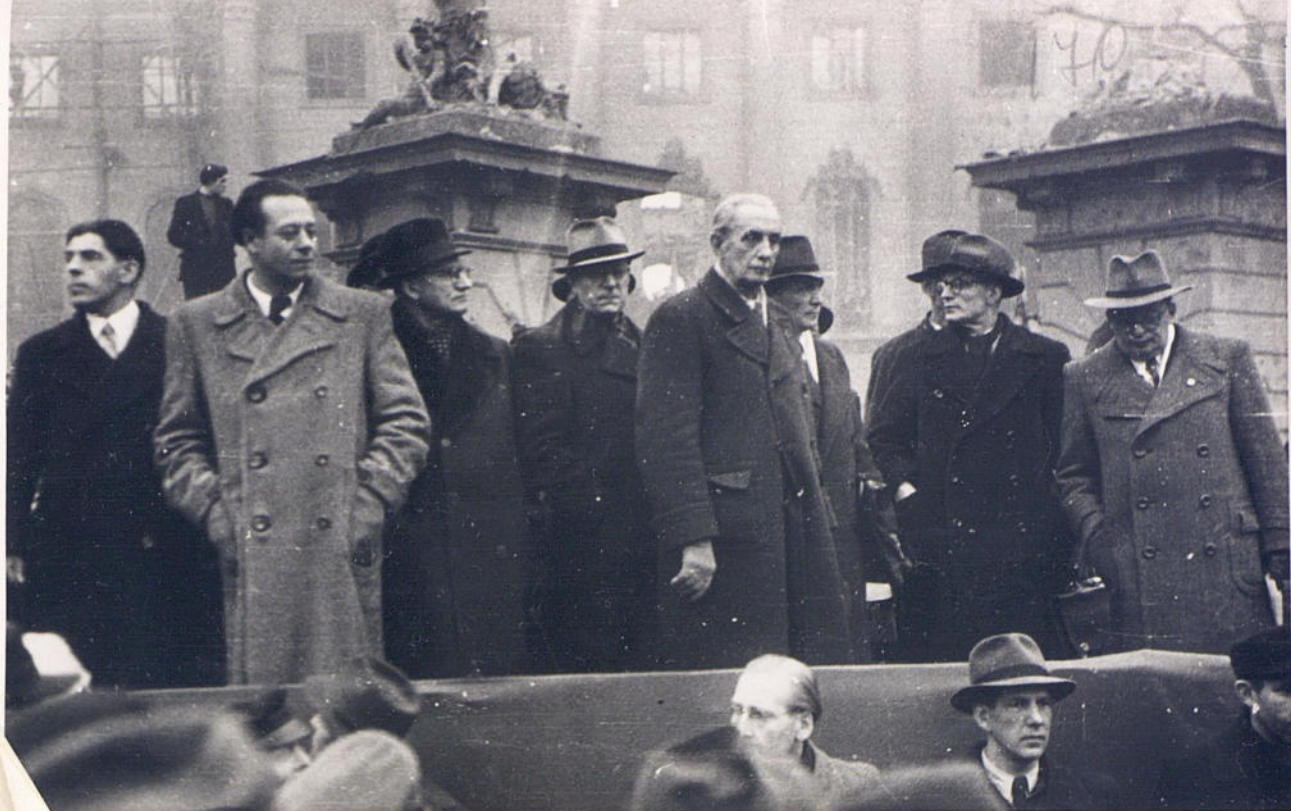
Городские советники демократического магистрата во главе с обербургомистром Ф. Эбертом приветствуют демонстрантов 30.11.48г