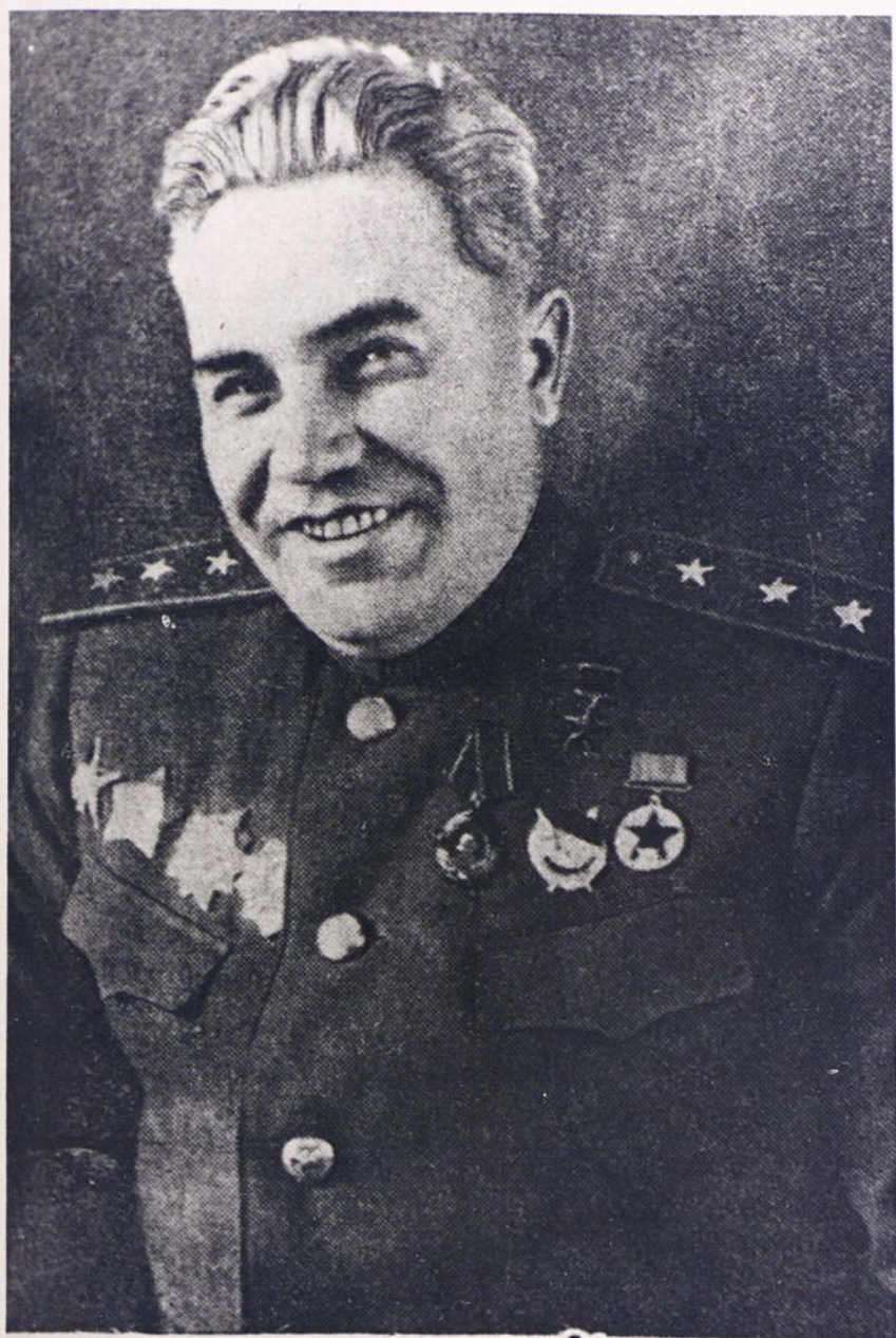
Первый комендант г. Берлин генерал-полковник Верзарин.