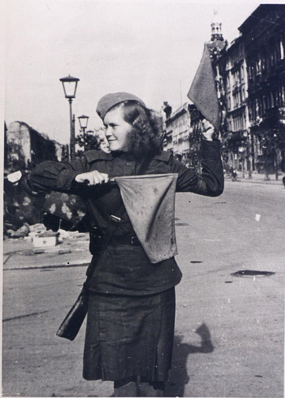
Советский регулировочный пост. Берлин Унтер ден Линден.