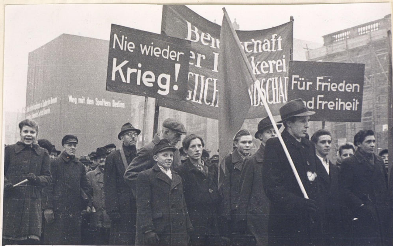
Массовая демонстрация трудящихся Берлина, посвященная созданию временного демократического магистрата 30.11.48г.