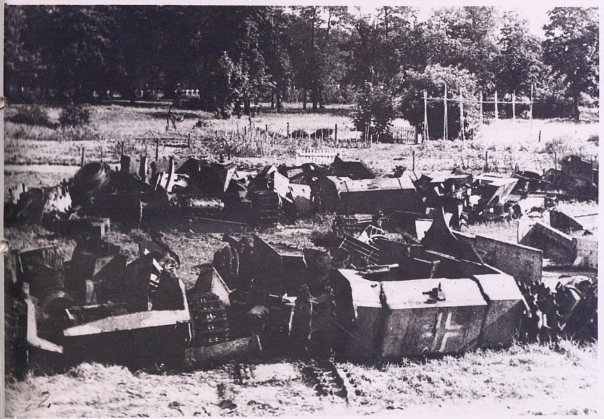
Нацистская военная техника превращена в металлолом.