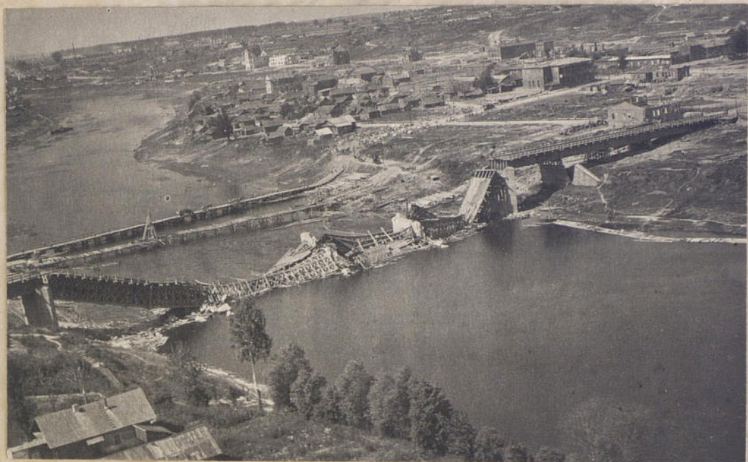
Шоссе́нный мост чре́з р. Зап. Двина́ в райо́не Вите́бск