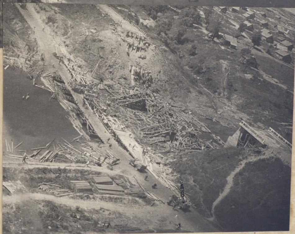
в районе Орш разрушенные немцами при отступлении.