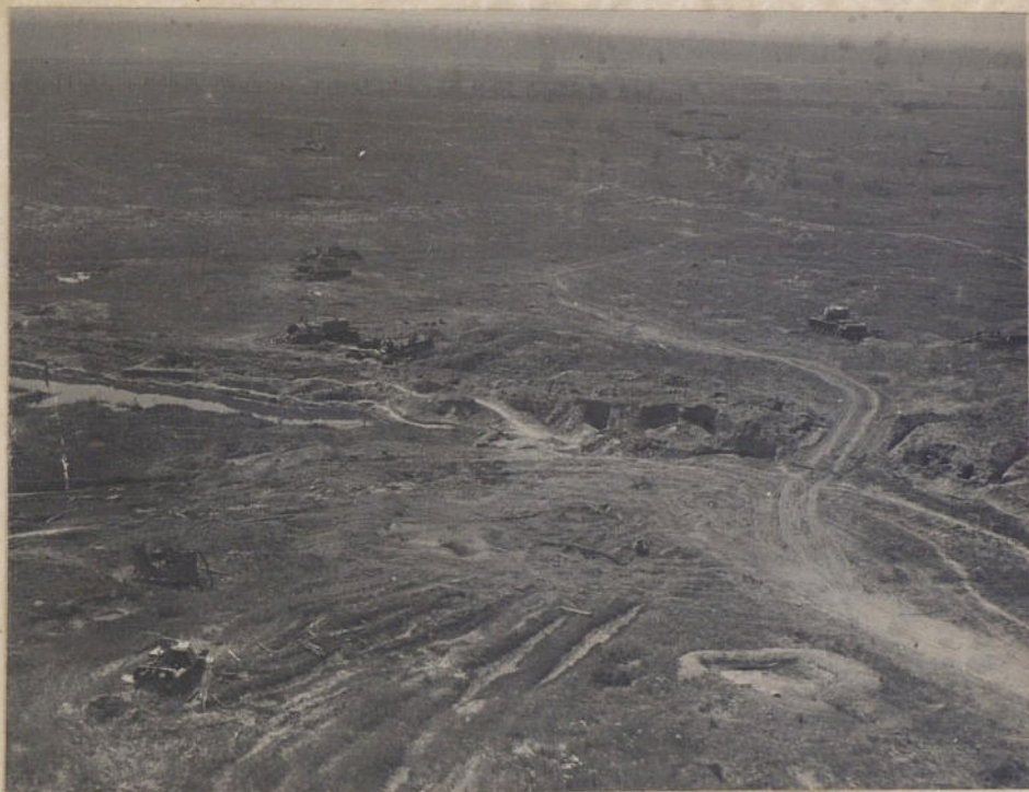
По́ле танко́вого бо́я на О́ршанском напра́влении