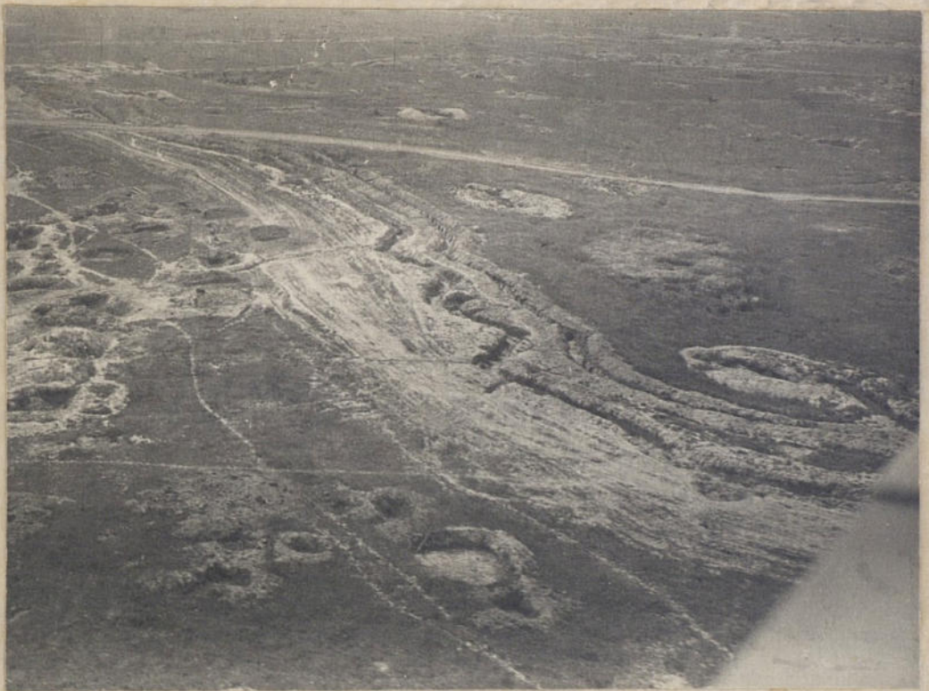
Промежуточный рубеж, отсечных позиций на Витебском направлении