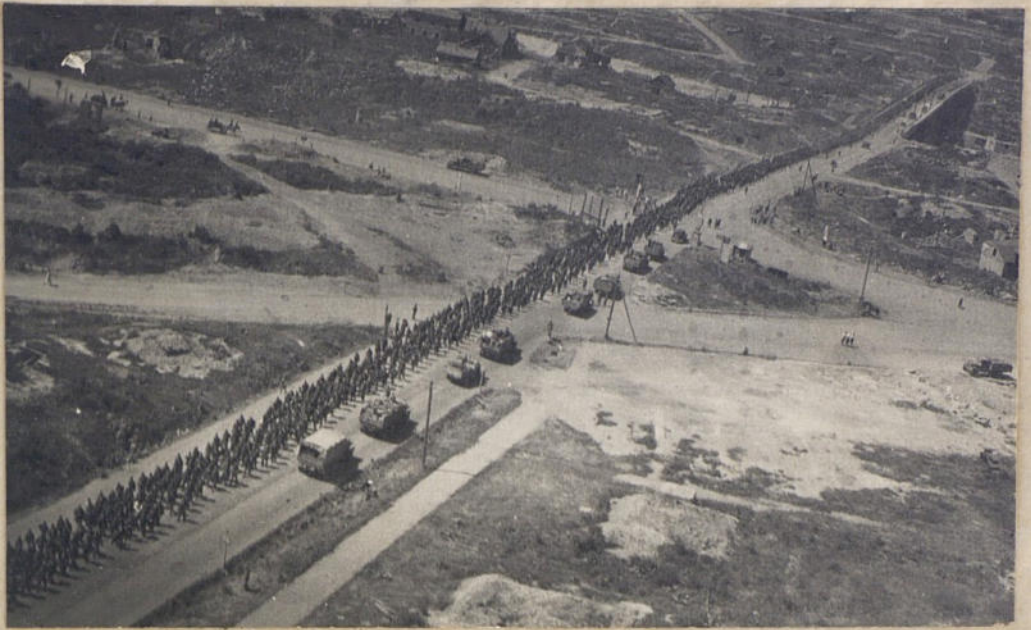
Колонна военнопленных палаток