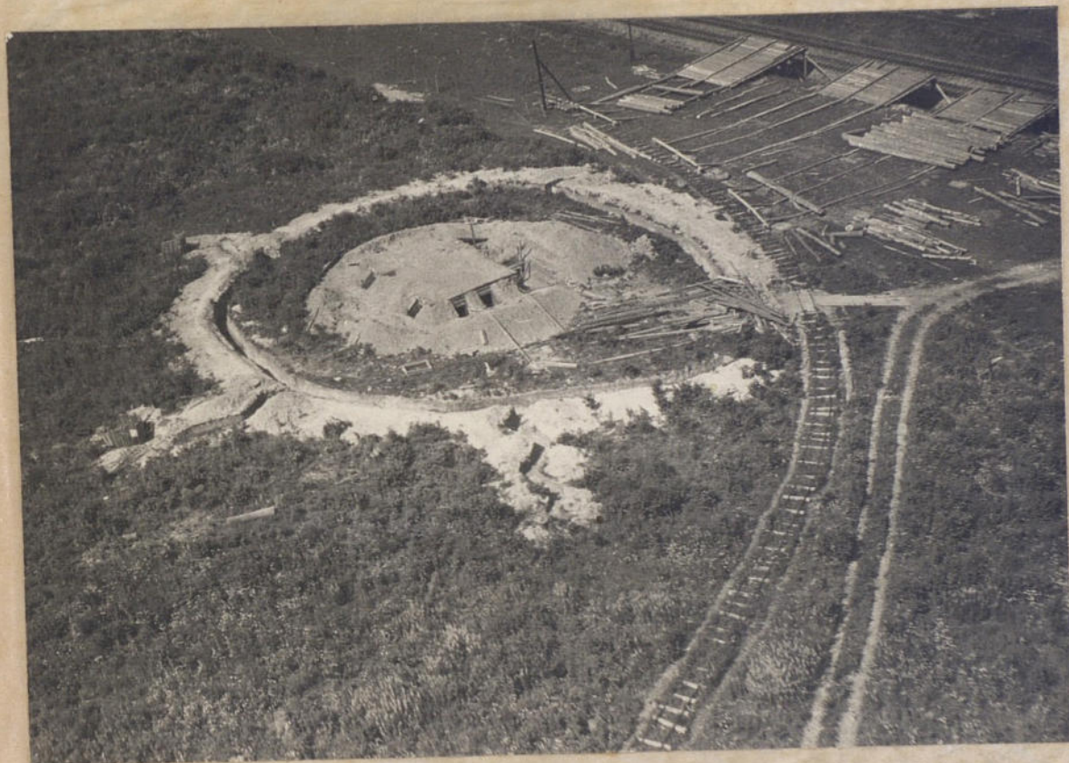
Один из ДЗОТов в районе ст.Сосновка /Витебское направление