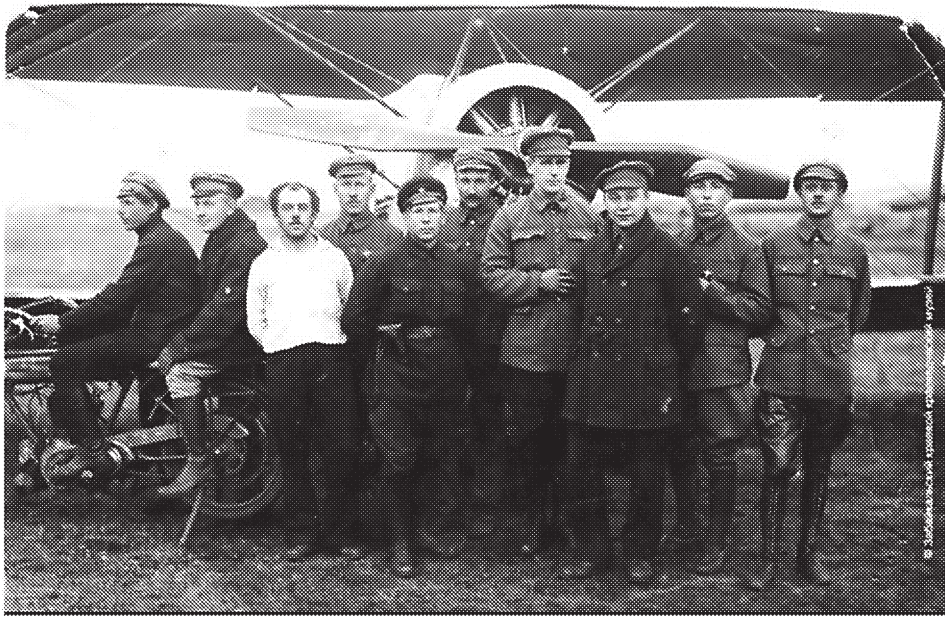
Рис. 2. Группа летчиков Первого авиаотряда НРА ДВР.

на забайкальской станции Гонгота. Было решено прекратить военные действия, причем японское командование взяло обязательство эвакуировать свои войска.