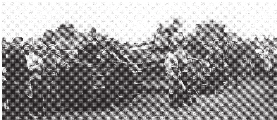
Рис. 3. Танки 1-го Амурского тяжелого дивизиона в Благовещенске. 10 августа 1920 г. [4, с. 32]

подобных бронированных машин никто в Забайкалье тогда не видел. Ярким примерам их применения является бой за ст. Урульга, 19 октября 1920 г. части 5-й Амурской бригады ДВР при поддержке танков 3-го взвода атаковали силы белых на ст. Урульга. По наступающим силам был открыт сильный артиллерийско-пулеметный огонь, однако появление танков произвело на силы противника сильное впечатление, и противник отошел. Станцию пехота НРА ДВР взяла без потерь.