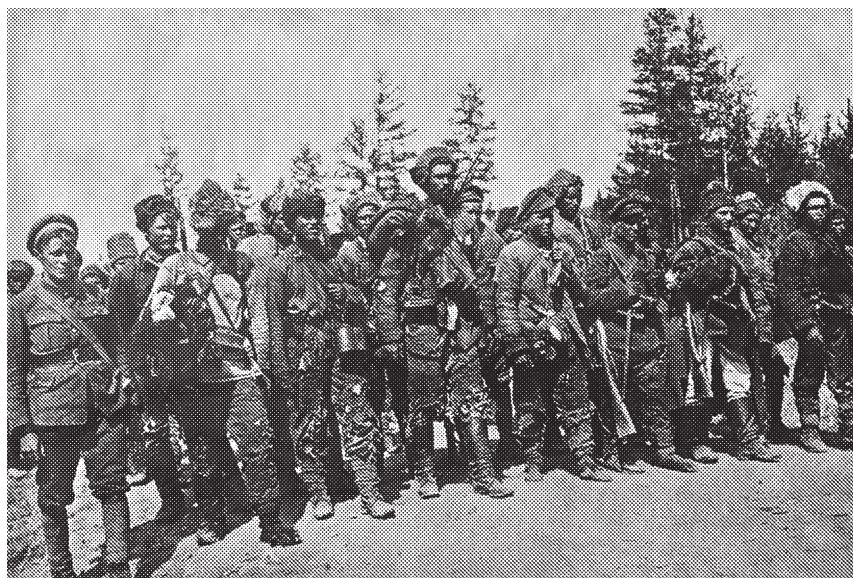
Рис. 1. Бойцы. Народно-революционная армия Дальневосточной республики, Верхнеудинск, 1920 г. [5, с. 88]

товок и пулеметов остановила японская пехота при поддержке тяжелой артиллерии в районе оз. Арахлей. 10 апреля основные силы НРА перешли в новое наступление и выбили закрепившегося противника, взяли с. Беклемишево, и уже через два дня – с. Смоленку. На подходах к г. Чите (улицы Лагерная, Нагорная и Новобульварная), 13 апреля, войска наткнувшись на сильное сопротивление японской пехоты и артиллерии, отошли от города к озерам Тасей и Иван, оставив свои главные передовые части на Яблоновом хребте, похоронив убитых, заняли оборону [8, с. 165]. С этого неудачного наступления и начался ряд наступательных операций под Читой.